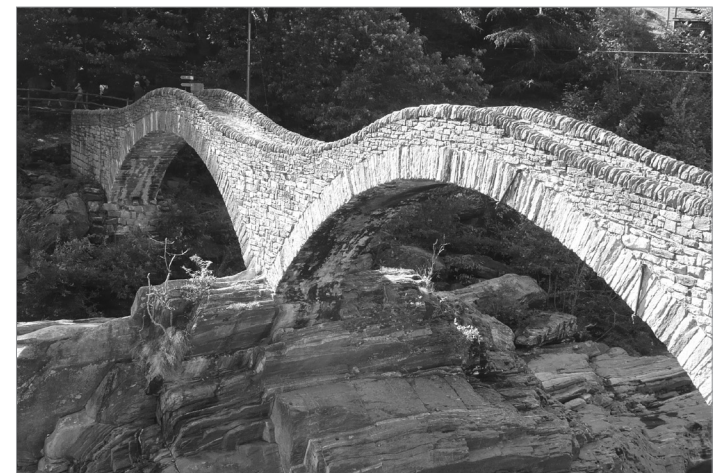
Themen und Bilder aus dem Unterricht